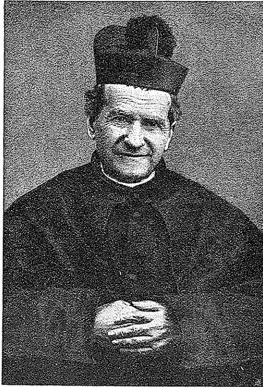
Ven. GIOVANNI BOSCO